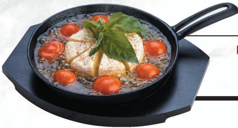
7 Whole Camembert Cheese Ajillo 丸ごとカマンベールのアヒージョ