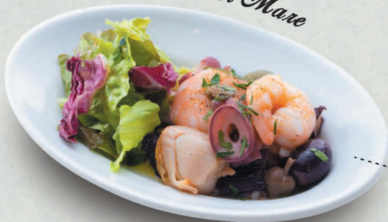
Frutti di Mare